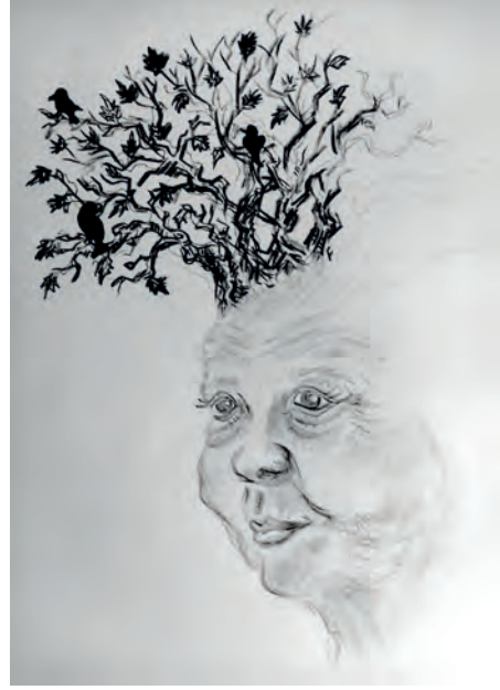
Çizer: Burak Gün

İki bahardan ilkbaharın baharlığı meşhur olsa da genç kızın fikrince sonbahar ilkinden bir adım önde. Zira tabiat, eşi menendi olmayan entarilerini o vakit giyinir, odunsu kokular sürünür, lahuri şallara bürünür. Hele bir de hava uzun süre ılık giderse değmesin kimse keyfine. Işığın geliş yönü aynı ağacın üzerinde bile farklı renkte yapraklar ve ünlü resamlara taş çıkaracak tablolar oluşturur. Kızıl rengin türlü tonlarına bürünür sarmaşıklar, yazın tadı kaçan sardunyalı,