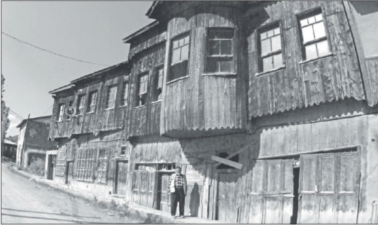
Kuruçay. Mustafa Kutlu'nun doğduğu sokaktan bir görünüm.