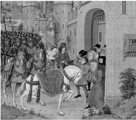
Isabella Bristol'ı hâkimiyeti altına alırken, Jean Froissart, Chroniques (Bibliothèque Nationale de France (MS FR 2643, f.9))