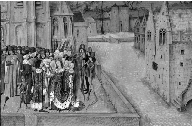
Isabella ve II. Edward'ın evliliği, Jean de Waurin, Chroniques d'Angleterre (İngiliz Kütüphanesi (MS Royal 15 E.IV f.295v))