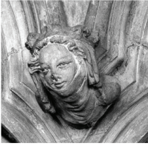
Fransalı Isabella, Beverley Minster'daki konsol başı, Yorkshire (Conway Kütüphanesi, Courtauld Sanat Enstitüsü)Yorkshire