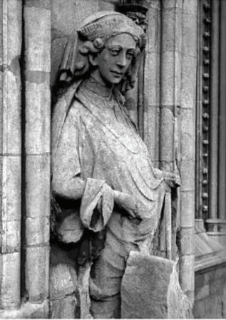
Fransalı Marguerite, Lincoln Katedrali'ndeki heykel