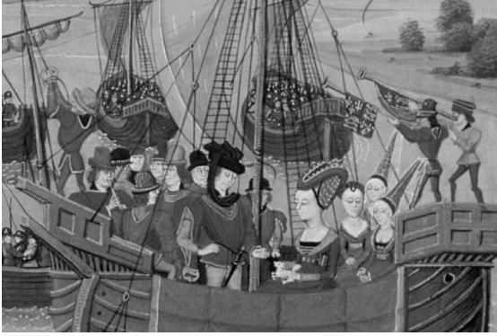
Isabella ordusuyla Hainault'dan yelken açarken, Jean Froissart, Chroniques (Bibliothèque Nationale de France (MS FR 2643, f.7v))