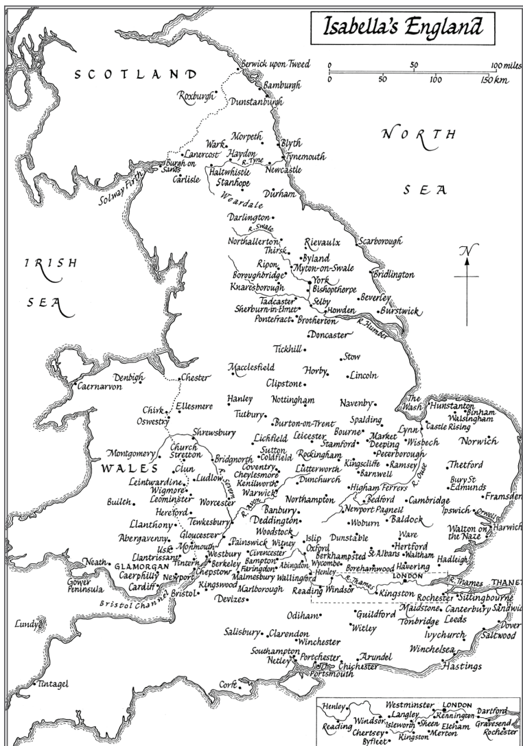
Isabella zamanında İngiltere