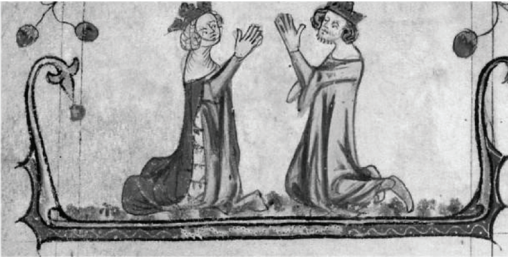
Bir Kral ve Kraliçe diz çökerken, Taymouth Hours (İngiliz Kütüphanesi (MS Yates Thompson 13, f.118v))