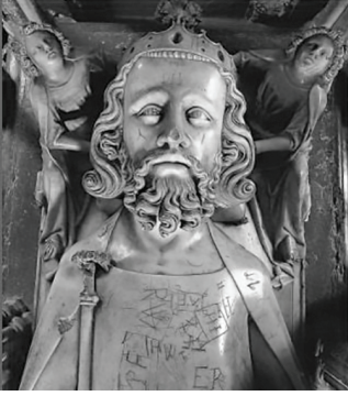
II. Edward, Gloucester Katedrali'ndeki temsili mezarın profili