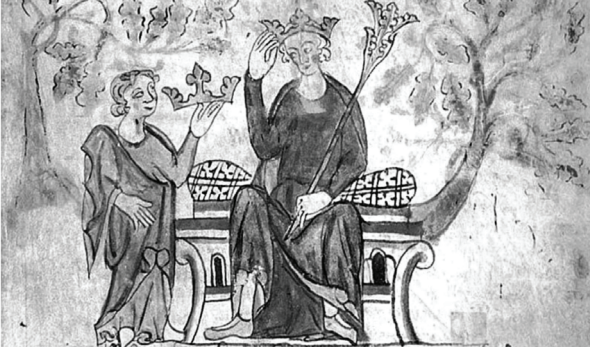
II. Edward, ođlu III. Edward lehine tahttan feragat ederken, Langtoft'lu Piers, Chronicle of England, (İngiliz Kütüphanesi (MS Royal 20 A II, f.10))