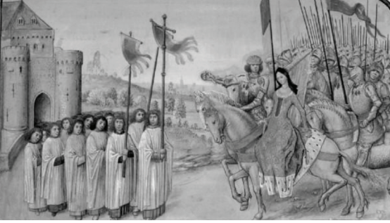
Isabella ve Roger Mortimer Oxford'a doğru ilerlerken