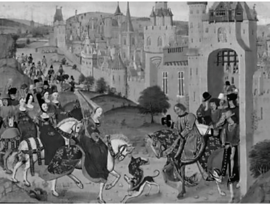
Charles IV Paris'te Isabella'yı karşılarırken, Jean Froissart, Chroniques (Bibliothèque Nationale de France (MS FR 2643, s.1))