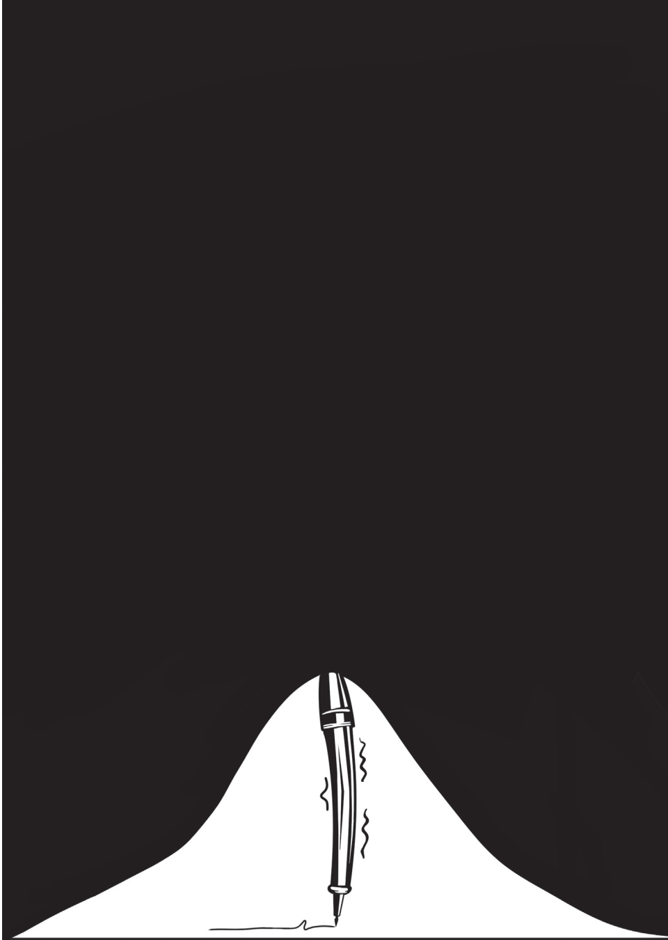
İllüstrasyon: Zeynep Hilal Özder