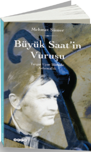
Büyük Saat'in Vuruşu Mehmet Sümer İnceleme / 216 syf.