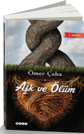
Aşk ve Ölüm Ömer Çaha Roman / 372 syf.