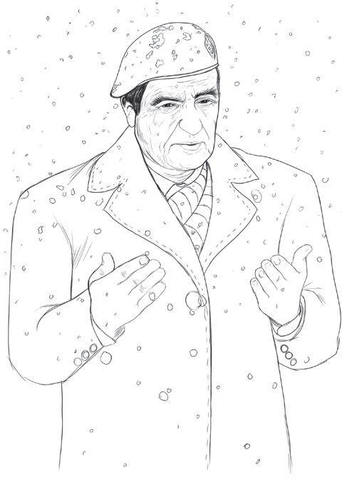
Çizgi: Uğur Polat

nü kazanarak seçimle ülkelerinin devlet başkanlığına gelmeleridir. Ama Aliya'yı Mandela'dan ayıran farklı bir özelliği, Aliya sadece mücadele ederek özgürlüğüne kavuşmadı, aynı zamanda yeni bir devletin kuruculuğunu da yaptı hatta yok olma sınırındaki bir halkın küresel bir oldu bittiye meydan vermeden özgür ve yeni devlete sahip bir toplum olmalarını sağladı. En önemlisi bu bilge adam, savaşta bir komutan olarak da mücadele etmek durumunda kaldı. Ayrıca Platona nazire yapar gibi 20. yüzyılda vicdan ve ahlâk sahibi erdemli bir entelektüelin ve daha önce hiçbir devlet deneyimi olmayan